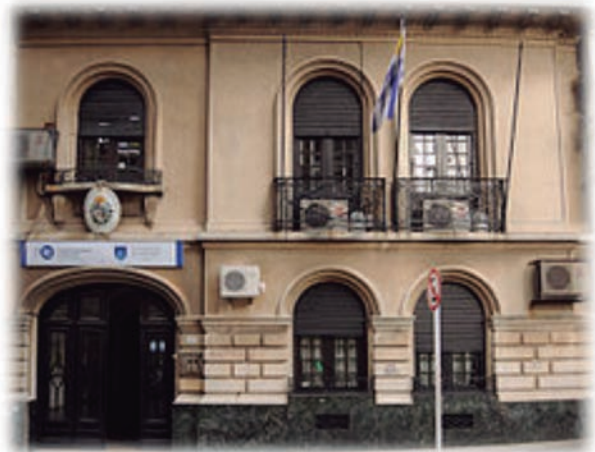
Fachada de la Escuela de Bibliotecología y Ciencias Afines.

La República Oriental del Uruguay es el único caso en la región –y creo que no me equivoco si digo del mundo– en el que se promovieron, debatieron, analizaron y aprobaron leyes que regulan el acceso a la información y la creación de un sistema nacional de archivos. Esto se debe quizás a la particular conformación de la alianza que promovió las normativas, el Grupo Archivos y Acceso a la Información Pública (GAIP), constituido por las organizaciones