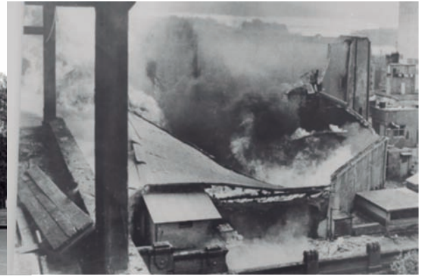
El SODRE antes y después del incendio.

que el AGN juzgue de carácter histórico; para tal fin establecía que todas pusieran a disposición de funcionarios del Archivo General especialmente designados toda documentación que guarden, a fin de proceder a su selección. 17