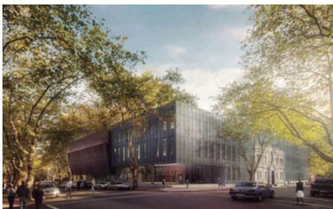
Fachada de la nueva Facultad de Información y Comunicación.

El 2 de diciembre del año 2013 la EUBCA se fusiona con la Facultad de Ciencias de la Comunicación; de esta manera concluye la historia institucional de la EUBCA “Ing. Federico E. Capurro”, 27 para comenzar a formar parte de la nueva Facultad de Información y Comunicación (FIC), conformada por dos institutos: Comunicación e Información. Concomitantemente se aprueba un nuevo plan de estudios para la Carrera de Archivología, que ahora tendrá cuatro años de duración y nuevos contenidos adecuados a las necesidades del s. XXI, y gracias a un esfuerzo de más de veinticinco años de la colectividad archivística, se logra convertir a la tecnicatura de archivología en licenciatura.