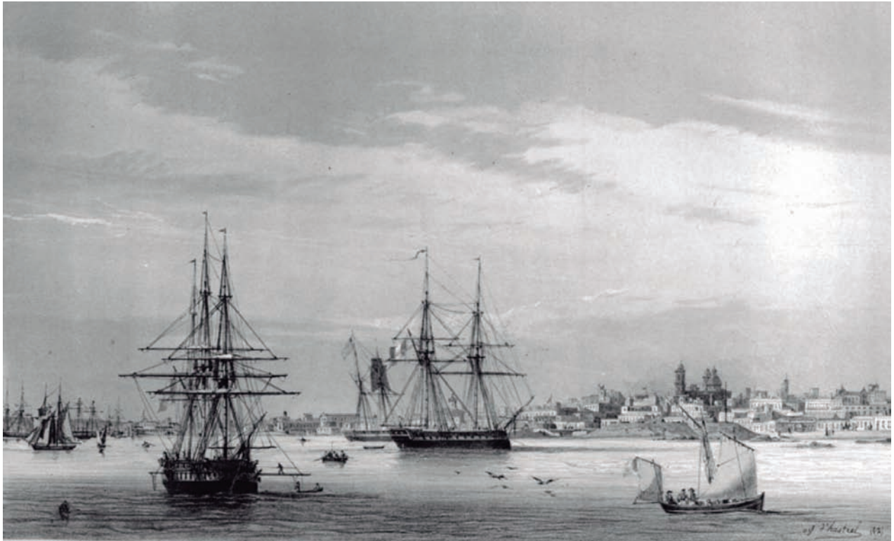
Montevideo desde la rada apostadero naval 1842.